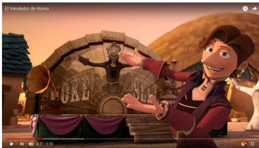
El Vendedor de Humo - PrimerFrame