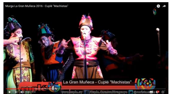
Murga La Gran Muñeca "Machistas"