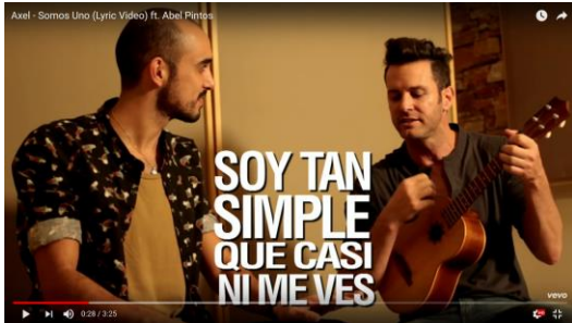
Somos Uno - Axel ft. Abel Pintos