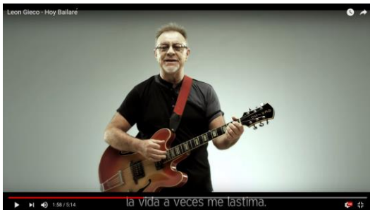
Leon Gieco - Hoy Bailaré