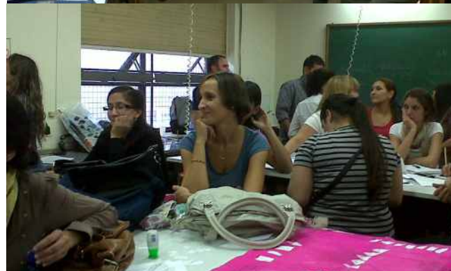
Docentes en Primer Encuentro del Curso “Aportes para la Enseñanza de la Biología en la Educación Secundaria”