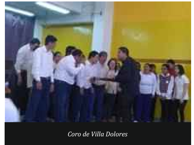
Coro de Villa Dolores