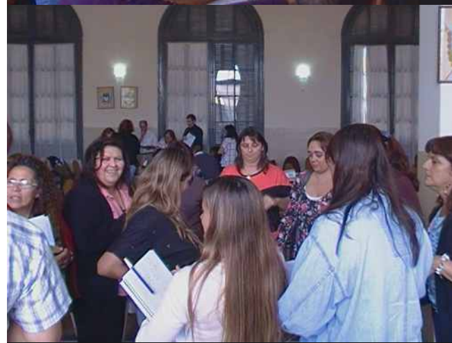
Docentes en la capacitación de Educación Tecnológica, IPEM Dr. César Milstein de la ciudad de Córdoba