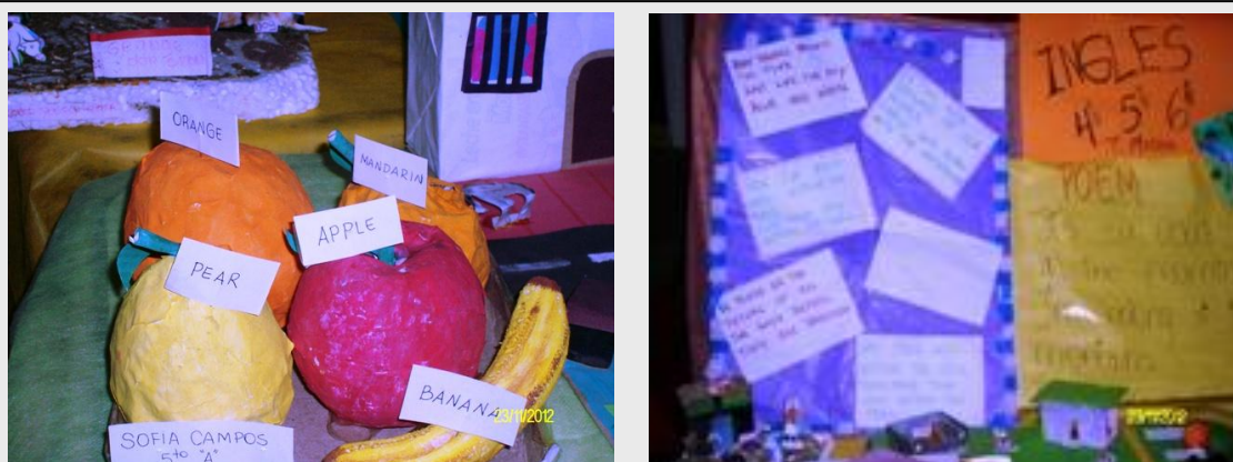
FOTOS DE LA "EXPO 2012" DE LA ESCUELA PRIMARIA PABLO PIZZURNO DE CRUZ DEL EJE. SON TRABAJOS DE LOS ALUMNOS DE 4º, 5º Y 6º GRADO SOBRE TEMAS DE LENGUA INGLESA EN LA JORNADA EXTENDIDA.

Asimismo, y dando continuidad a los procesos de formación en Lengua Inglesa, se implementó el CURSO DE PROFUNDIZACIÓN Conocimiento de la lengua inglesa en el marco de situaciones de interacción comunicativa. Este curso también está dirigido a docentes de Jornada Extendida de Educación Primaria a fin de recuperar y fortalecer los conocimientos previos, incorporar saberes lingüísticos de mayor complejidad, así como elementos discursivos y pragmáticos, y perfeccionar aspectos fonológicos y fonéticos de la lengua inglesa para que los docentes puedan lograr mayor fluidez y precisión. La primera cohorte de este curso dio inicio en el mes de agosto de 2012 y finalizará en mayo de 2013 y se desarrolla en 3 sedes de Capital y una sede en Cruz del Eje, Río Cuarto, San Francisco, Villa del Totoral, Villa Dolores y Villa María, con un total de 200 cursantes.