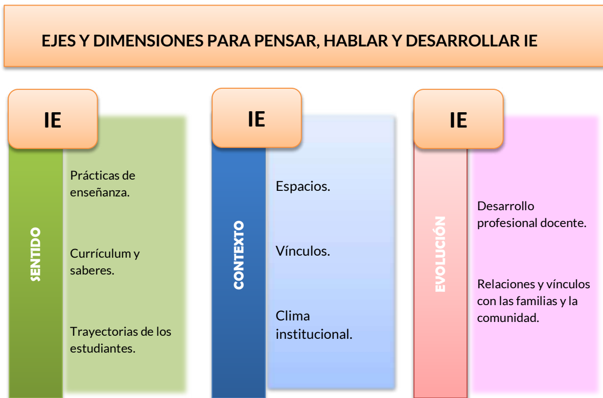
Fig. 1. Desde qué lugar pensar, hablar y desarrollar IE.

Como ya se ha dicho, los ejes que se han mencionado son: el sentido , el contexto , la evolución . Cada uno de ellos comprende una serie de dimensiones que dan consistencia a las categorías propuestas, tal como se muestra en la siguiente figura.