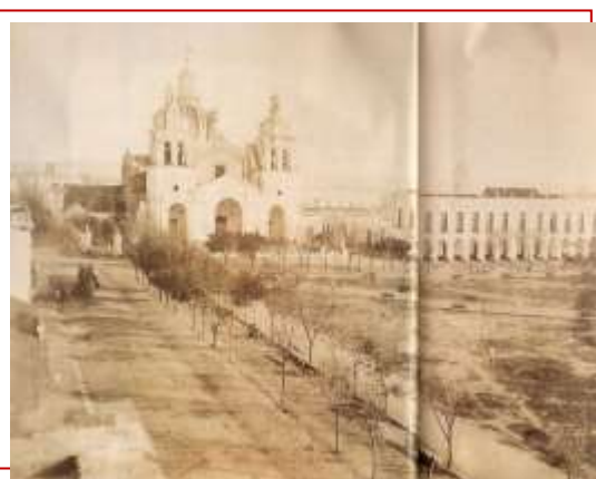
Ciudad de Córdoba