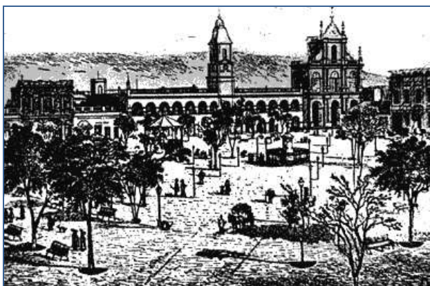
San Miguel de Tucumán