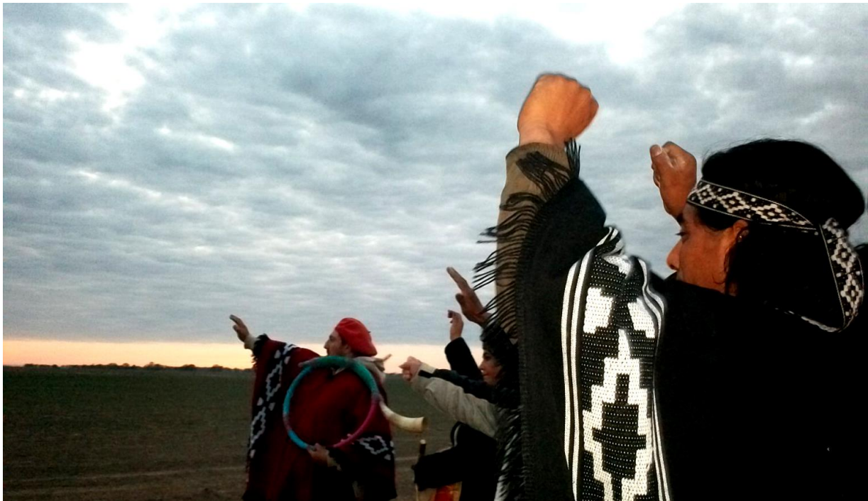
Imagen: Del Campillo, 24 de junio de 2014, en momentos en que se conmemoraba el año nuevo ranquel (We Tripantü).

El pueblo Ranquel o Rankulche es una nación preexistente a la formación del Estado argentino. En la actualidad, se organiza a través de diversas comunidades que, en su mayoría, integran la Confederación de la Nación Rankulche . Su presencia territorial es vasta, con familias y organizaciones radicadas en las provincias de La Pampa, San Luis, Buenos Aires, Santa Fe y Córdoba.