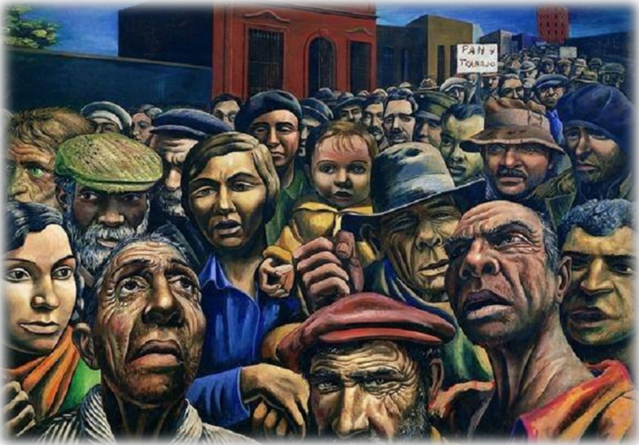
Manifestación, Antonio Berni (1934)

El Día Internacional de las/os Trabajadoras/es quedó instituido el 1° de mayo de 1889, en París, durante el Congreso de la Asociación Internacional de Sindicatos Europeos. Esa fecha se estableció como jornada de lucha por la Segunda Internacional para perpetuar la memoria de los «mártires de Chicago», obreros caídos en los hechos de mayo de 1886 en los Estados Unidos, cuando en la Haymarket Square de Chicago una violenta represión intentó detener una de las tantas protestas que llevaban a cabo las organizaciones laborales en todo el país norteamericano.