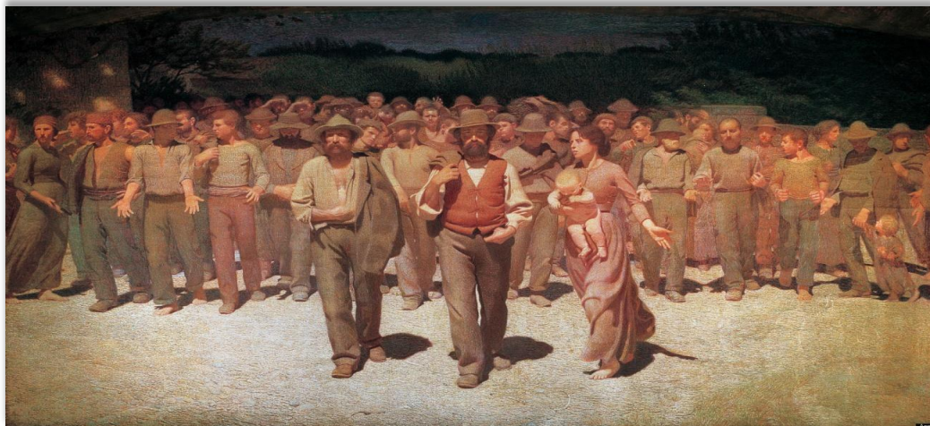
Giuseppe Pellizza da Volpedo: "El cuarto estado" (1901). Milán.