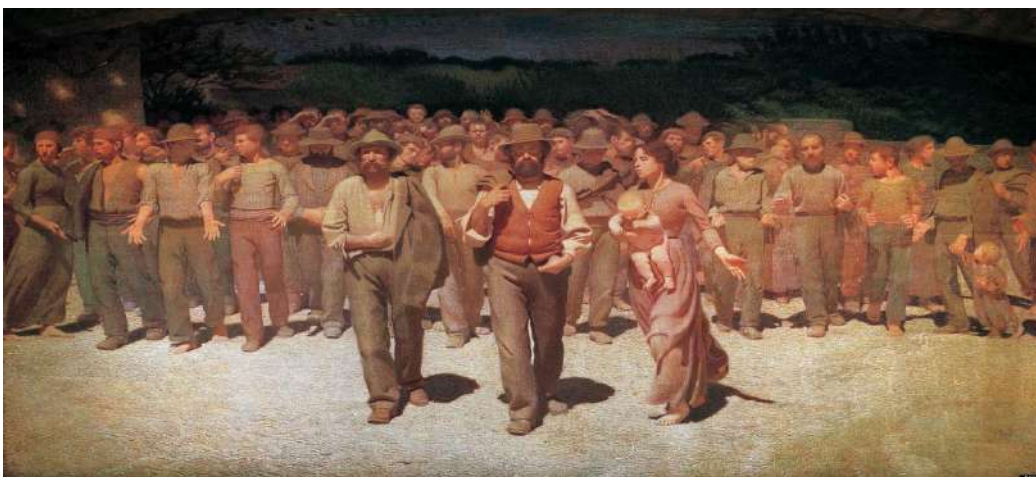
Giuseppe Pellizza da Volpedo: "El cuarto estado" (1901). Milán.