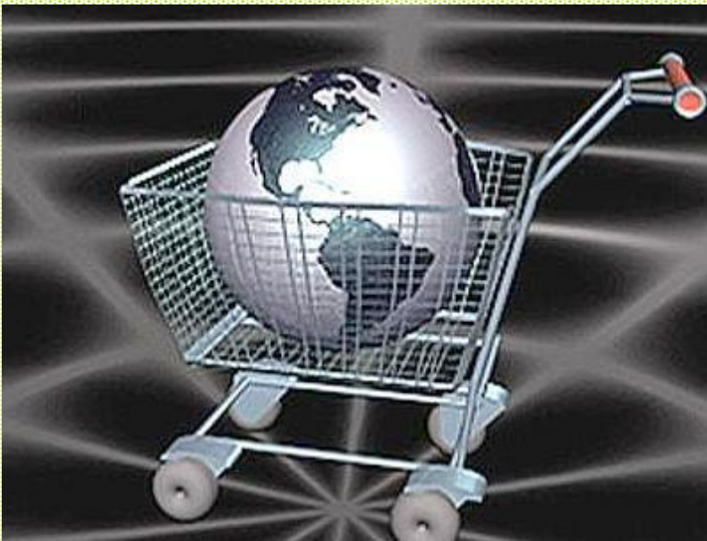
El planeta en un carrito de supermercado.