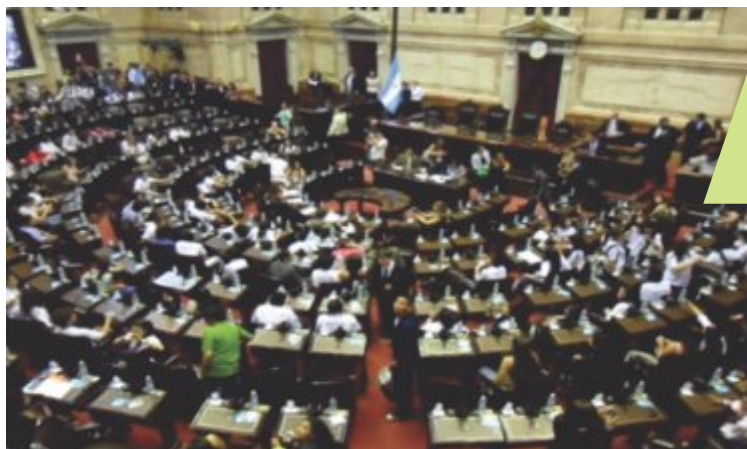
HONORABLE CÁMARA DE DIPUTADOS DE LA NACIÓN ARGENTINA. NOVIEMBRE 2012.

Otro objetivo es desarrollar la identidad mercosuriana de los jóvenes sobre la base de valores que estimulen la ciudadanía, el respeto por la democracia, el compromiso con los derechos humanos y la conciencia social, entre otros.