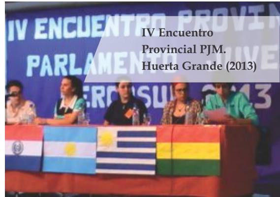
IV Encuentro Provincial PJM. Huerta Grande (2013)

En esta instancia, se realiza además la elección del joven parlamentario que representará a la provincia, para lo cual se tienen en cuenta la argumentación de sus posturas, la expresión de sus ideas, el desempeño en las dinámicas parlamentarias, el sentido de pertenencia a un “nosotros” común. Se selecciona también la delegación de 30 jóvenes que participarán del encuentro nacional, esta elección se hace democráticamente y por votación entre los mismos estudiantes.