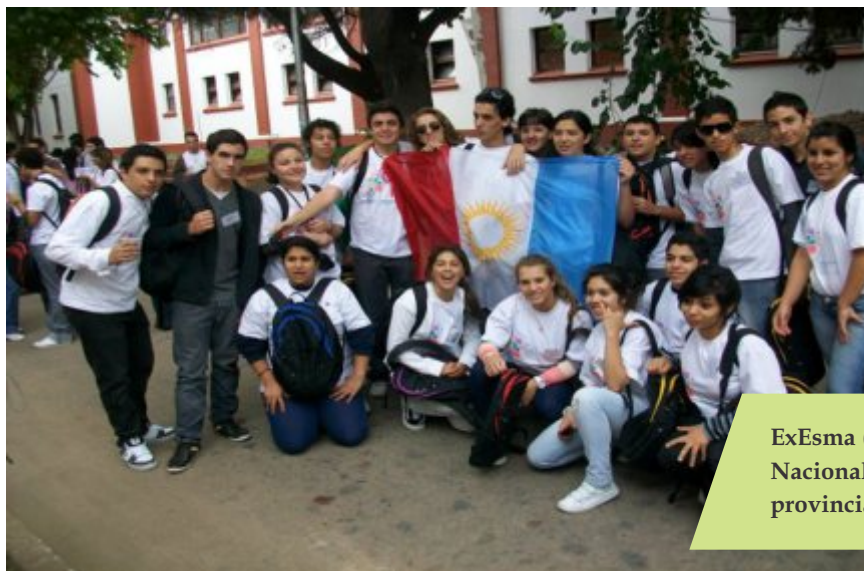
ExEsma (CABA) Encuentro Nacional PJM, delegación provincial 2012.

El objetivo jurisdiccional en la selección de las escuelas fue que el mandato provincial que surgiera del Parlamento Provincial fuera representativo de los diversos contextos geográficos, sociales y económicos que están presentes en nuestra provincia, para lo cual se incluyeron escuelas de la región Noreste, Noroeste, Centro, Sureste, Suroeste, de manera tal que las problemáticas, necesidades y expectativas que se les presentan a nuestros jóvenes en cuanto a la escuela secundaria que desean, quedaran representadas en su totalidad.