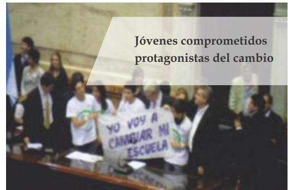
Jóvenes comprometidos protagonistas del cambio

“Declaración Nacional del Parlamento Juvenil Mercosur” sobre qué escuela secundaria quieren.