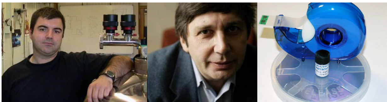
Figura 2. Los co-descubridores del grafeno: Kosya Novoselov, Andrey Geim y una cinta adhesiva.

visar la cinta adhesiva en vez de simplemente tirarla —lo que era la costumbre en el laboratorio. Grande fue su sorpresa al descubrir que adheridas se encontraban fragmentos individuales, de entre 40, 20, 10 capas, hasta las codiciadas de 1 capa: grafeno. El descubrimiento tomó por sorpresa a todo el mundo, y rápidamente la técnica del “Scotch-tape” se popularizó y extendió. Numerosos grupos podían ahora estudiar las exóticas propiedades del grafeno y explorar sus potenciales aplicaciones en el desarrollo de nuevos transistores que podrán sustituir al silicio en las computadoras futuras, nuevos materiales para la construcción de pantallas planas transparentes, paneles luminosos, celdas solares y múltiples usos más.