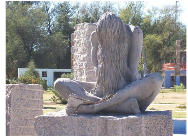
MONUMENTO LA LEYENDA DE POPOPIS (VILLA MERCEDES, SAN LUIS)

Pista 3: Adivina adivinador... ¿qué ríos, montañas, lagos, plantas, animales conocemos que tienen nombres originarios? El docente guía el descubrimiento poniendo énfasis en los conocimientos que los estudiantes