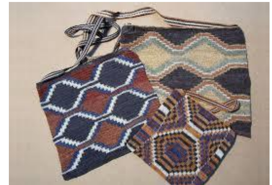
OBRAS TEXTILES HECHAS CON FIBRAS DE CHAGUAR