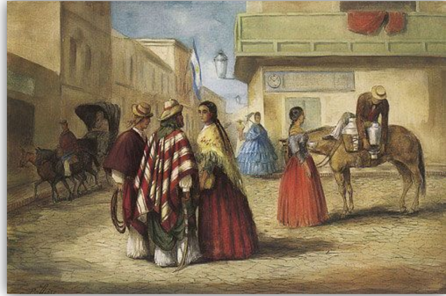
Esquina porteña , de Juan León Pallière

https://es.wikipedia.org/wiki/Archivo:Baile_del_Santiago_antiguo.jpg