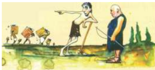
Ser esclavo en Atenas.

Licio le pidió disculpas y se quedó pensando en esos campesinos, porque vivían mucho mejor que él. Aunque tuviesen que trabajar para los terratenientes, eran dueños de sí mismos, nadie podía comprarlos ni venderlos. Tenían algo maravilloso que él había perdido: la libertad.