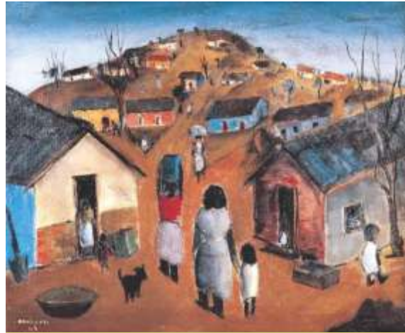
JOSÉ PANCETTI (1902-1958): Morro, 1947. Óleo sobre tela, 38 x 46 cm. São Paulo, Coleção Fluxo Comércio e Assessoria Internacional S/A