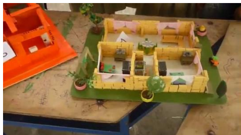
Imagen disponible en https://i.ytimg.com/vi/-PmOPduPeMA/maxresdefault.jpg

"2020 - Año del Bicentenario del Paso a la Inmortalidad del General Manuel Belgrano"