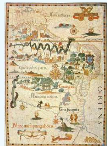
El mapa de Diego Homem, de 1558, muestra las tierras sudamericanas, el “Mundus Novus” desde las antillas hasta la Patagonia (“Terra Incognita”).